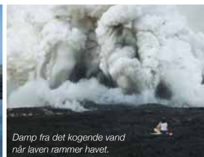
Damp fra det kogende vand når laven rammer havet.