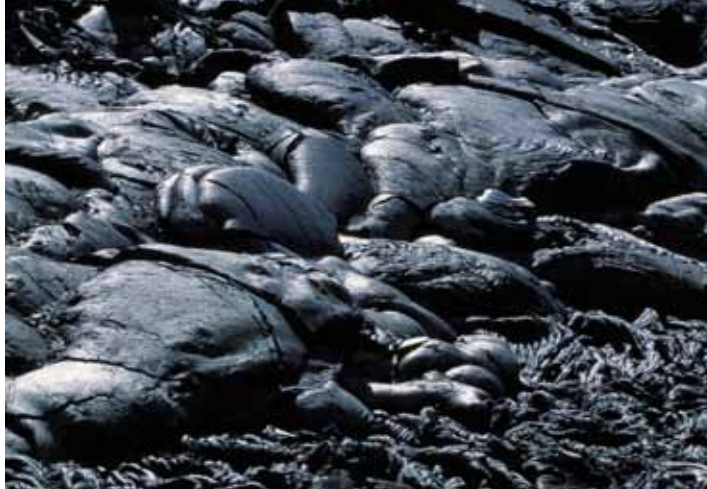
Den langsomt flydende Pahoehoe lava danner formationer i alle variationer.