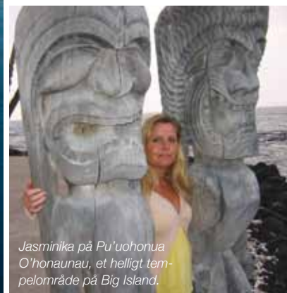
Jasminika på Pu'uohonua O'honau, et helligt tempeleområde på Big Island.

delfinen en luftboble, denne gang et par meter under min mave. Boblen flyder op og kilder min mave da den rammer den. Delfinen kigger ud af øjenkrogen på mig, mens den forsvinder med et smil på læben hen til den øvrige flok.