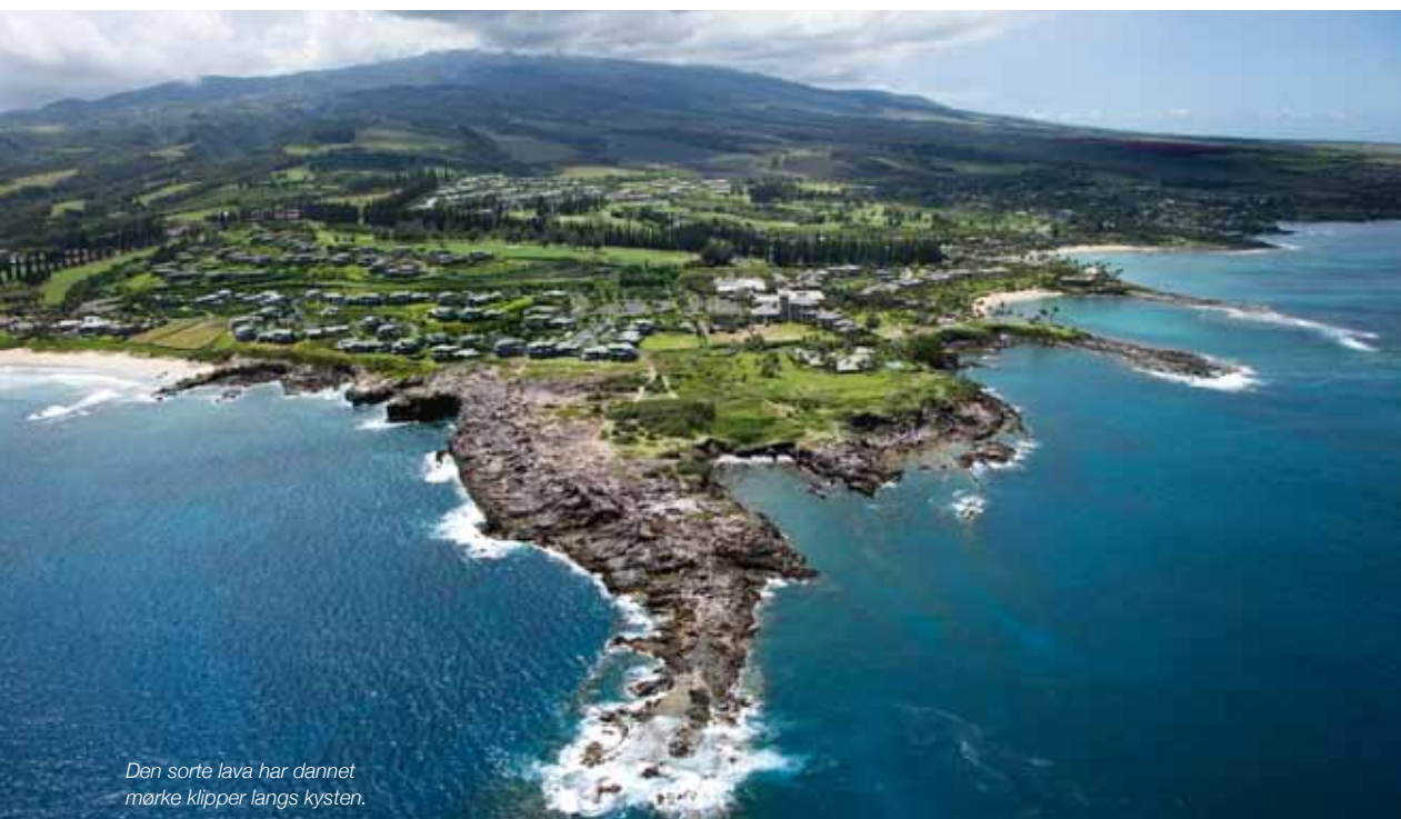
Den sorte lava har dannet mørke klipper langs kysten.