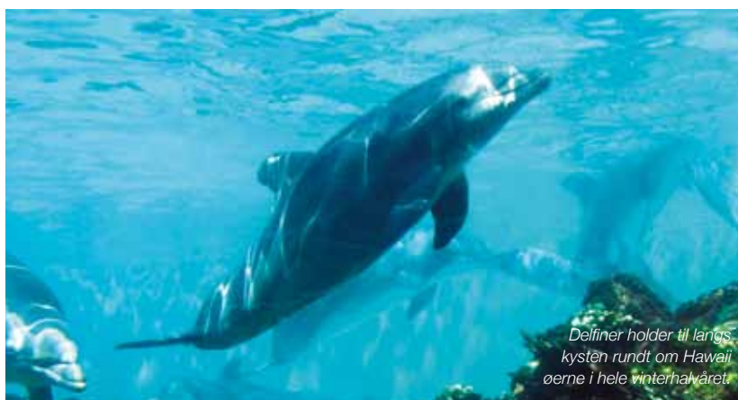
Delfiner holder til langs kysten rundt om Hawaii øerne i hele vinterhalvåret.

For hvert skridt jeg tager, knuses lavaen højlydt under mine fødder. Det føles som at gå på cornflakes og lyder ligesådan. Det næsten overnaturlige landskab ligger ujævnt i et plateau midt mellem ild og vand, vulkan og hav. Jeg stopper op. Pludselig er det som om, der sker noget med lyset. Solen når kun lige at forsvinde i Stillehavets horisont, da alt begynder. Jeg ser de rødlige nuancer spredes langsomt på himlen. Og så, som i en eksplosion af lys orange og mørk rød forvandles himlen til det smukkeste syn - farvet af den glødende lava der løber ned langs vulkanens sider. Mens jeg går videre, mærker jeg den stigende varme og dampen, der stiger op fra revner og sprækker under mig. Ved mit mål står jeg målløs og ser, hvordan lavaen møder havet og sender et inferno af damp til himmels. Kaskader af lava strømmer med op fra jordens indre og op gennem jordoverfladen med en enorm og ufattelig kraft. Jeg mærker kraften strømme igennem mig, bliver ét med den og lader den eliminere alle følelser af frygt, tvivl og frustration. Intet bliver efterladt - og jeg står tilbage med en følelse så ren, fri og intens.